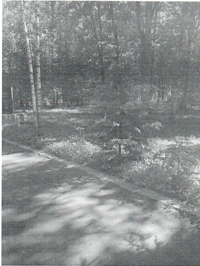
Рис. 1. Фото места установки на территории мемориала