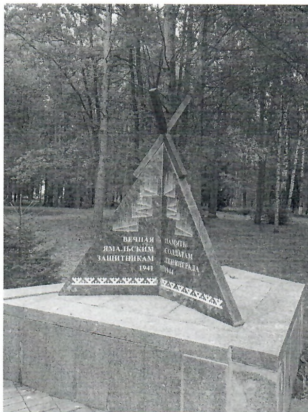
Рис. 2.