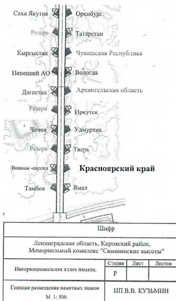
Схема расположения памятного знака в честь воинов-красноярцев, участвовавших в битве за Ленинград в годы Великой Отечественной войны, для установки на Интернациональной аллее Памяти объекта культурного наследия федерального значения «Синявинские высоты» – место ожесточенных боёв советских войск с немецко-фашистскими оккупантами в 1941-1944 гг.»

Приложение № 1 к Положению о порядке и условиях проведения открытого конкурса на разработку эскизного проекта памятного знака в честь воинов-красноярцев, участвовавших в битве за Ленинград в годы Великой Отечественной войны, для установки на Интернациональной аллее Памяти объекта культурного наследия федерального значения «Синявинские высоты» – место ожесточенных боёв советских войск с немецко-фашистскими оккупантами в 1941-1944 гг.»