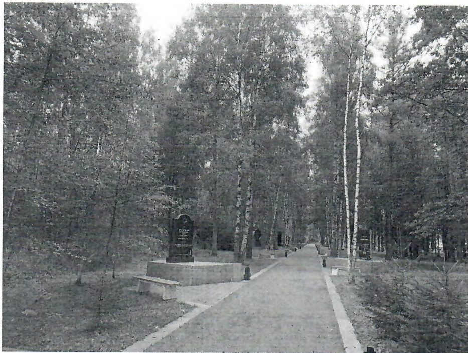
Рис. 3.